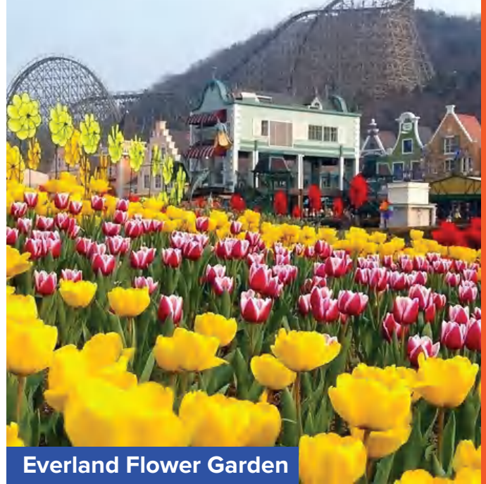
Everland Flower Garden