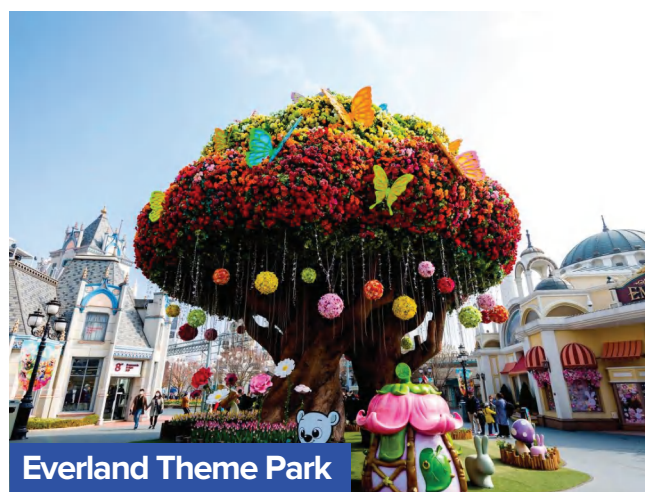
Everland Theme Park