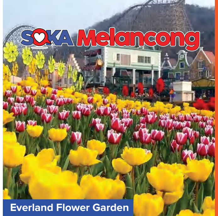
Everland Flower Garden