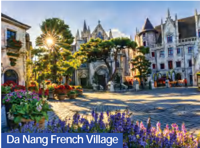
Da Nang French Village