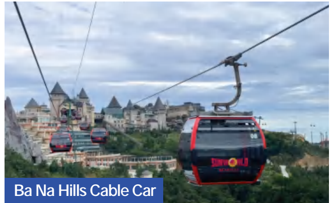
Ba Na Hills Cable Car