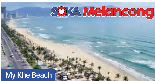
My Khe Beach