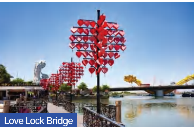
Love Lock Bridge