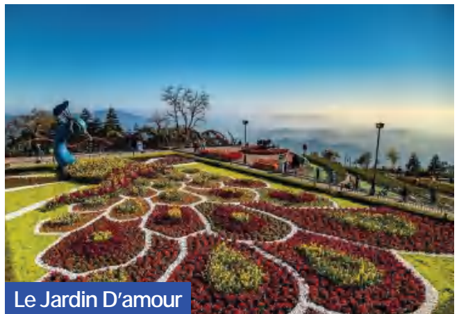
Le Jardin D'amour