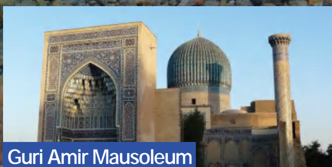
Guri Amir Mausoleum