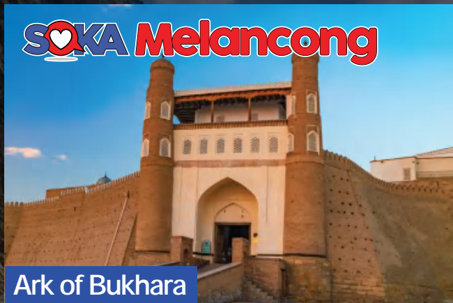
Ark of Bukhara