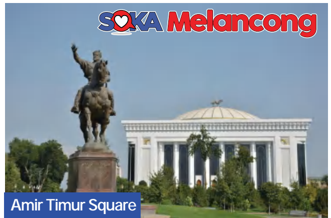
Amir Timur Square