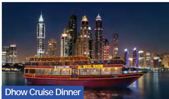
Dhow Cruise Dinner