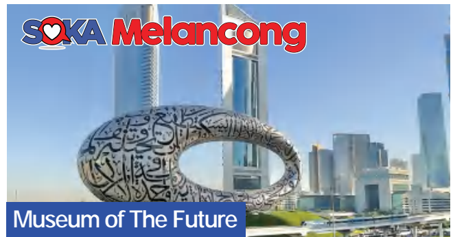
Museum of The Future