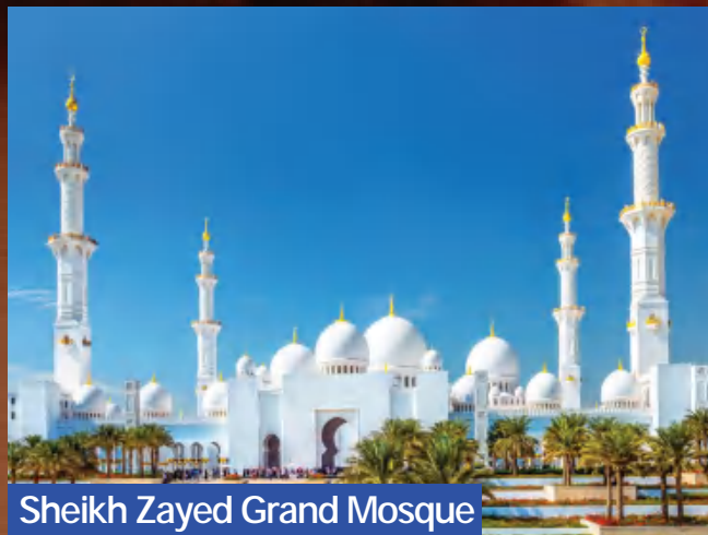
Sheikh Zayed Grand Mosque