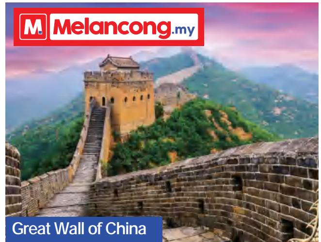
Great Wall of China

Great Wall of China: Tembok pertahanan yang dikira sebagai salah satu keajaiban dunia ini dibina seawal kurun ke-7 sebelum masihi dan dipanjangkan oleh maharaja-maharaja yang memerintah negara China sehingga mencecah sepanjang 21,000 km. Tetamu akan dibawa melawat ke salah satu seksyen yang dipanggil Juyongguan Great Wall yang dibina oleh Dinasti Ming pada 1368. Di seksyen ini berlakunya banyak peperangan dan pertukaran dinasti kerana tembok Juyongguan ini dibina bagi mempertahankan kota Beijing. Di sini juga tetamu dapat menikmati pemandangan indah pergunungan Guangou dan sungai.