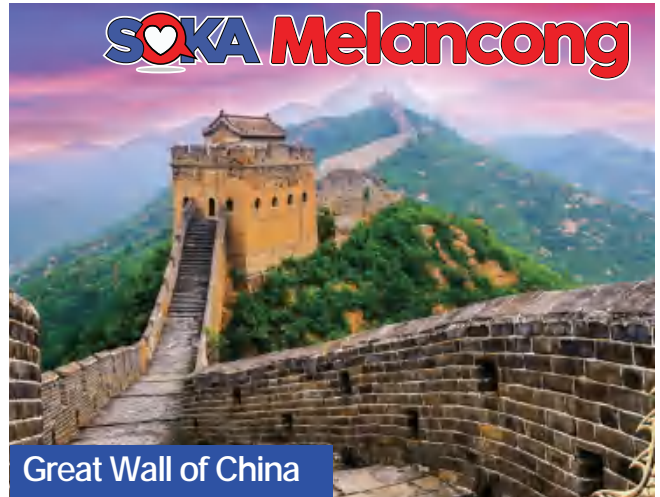
Great Wall of China

Great Wall of China: Tembok pertahanan yang dikira sebagai salah satu keajaiban dunia ini dibina seawal kurun ke-7 sebelum masihi dan dipanjangkan oleh maharaja-maharaja yang memerintah negara China sehingga mencecah sepanjang 21,000 km. Tetamu akan dibawa melawat ke salah satu seksyen yang dipanggil Juyongguan Great Wall yang dibina oleh Dinasti Ming pada 1368. Di seksyen ini berlakunya banyak peperangan dan pertukaran dinasti kerana tembok Juyongguan ini dibina bagi mempertahankan kota Beijing. Di sini juga tetamu dapat menikmati pemandangan indah pergunungan Guangou dan sungai.