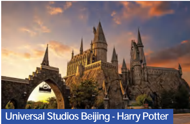
Universal Studios Beijing - Harry Potter