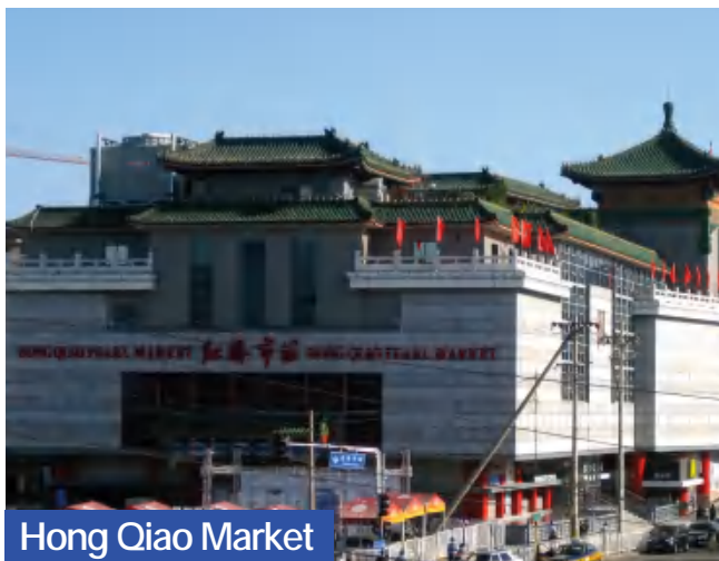
Hong Qiao Market