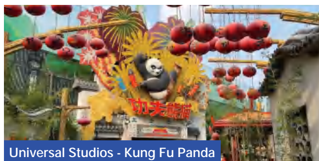
Universal Studios - Kung Fu Panda